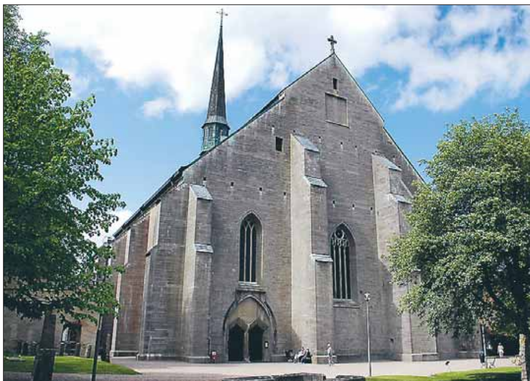
När drotsen år 1386 blev akut bröstsjuk lät han sig föras till Vadstena kloster och tillreda sig en sjukbädd. Han befallde att de gårdar han med orätt hade tillskansat sig och inte betalade till sitt fulla värde skulle gå tillbaka till de tidigare ägarna. Då fanns här ett trakapell, kring detta byggdes klosterkyrkan som togs i bruk i början av 1400-talet.

En rubrik i den här utmärta boken har "Biskopsmord i