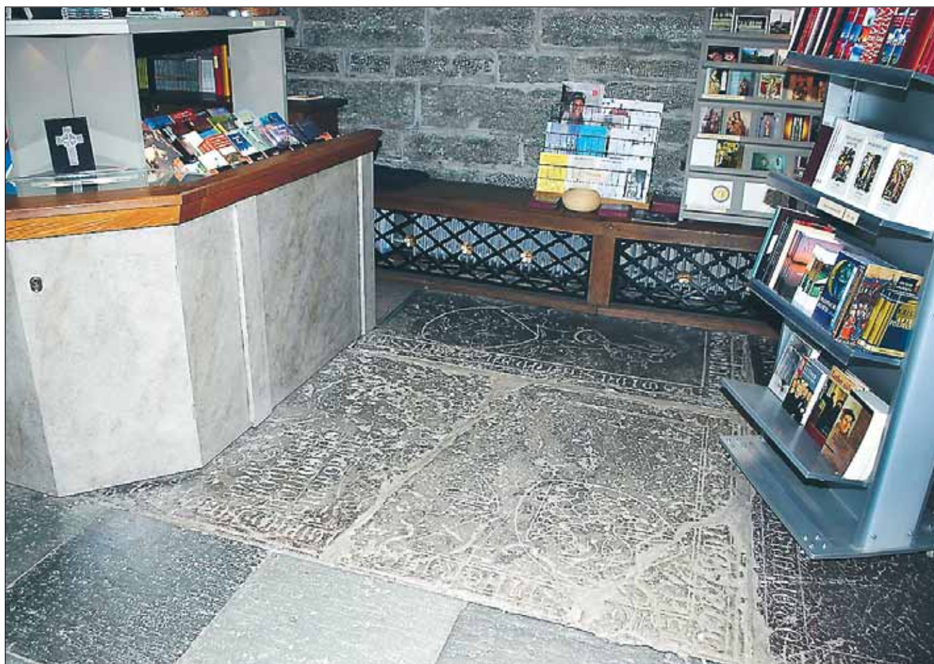
I Vadstena klosterkyrka ligger Bo Jonsson Grip begravd, och stenen, som till största delen skymms av informationsdisken, ligger i dag ungefär på samma plats som på den äldsta bevarade gravkartan från senare delen av 1600-talet. Men det är ju inte säkert att det är den ursprungliga placeringen. Vid en utgrävning 1922 påträffades flera skelett men inga bevis på att det skulle röra sig om Bo Jonsson Grips familjegrav framkom.

Han var rikt begåvad inom många områden och ägde en ljus och generös sida, men även en mörk och skrämmande.