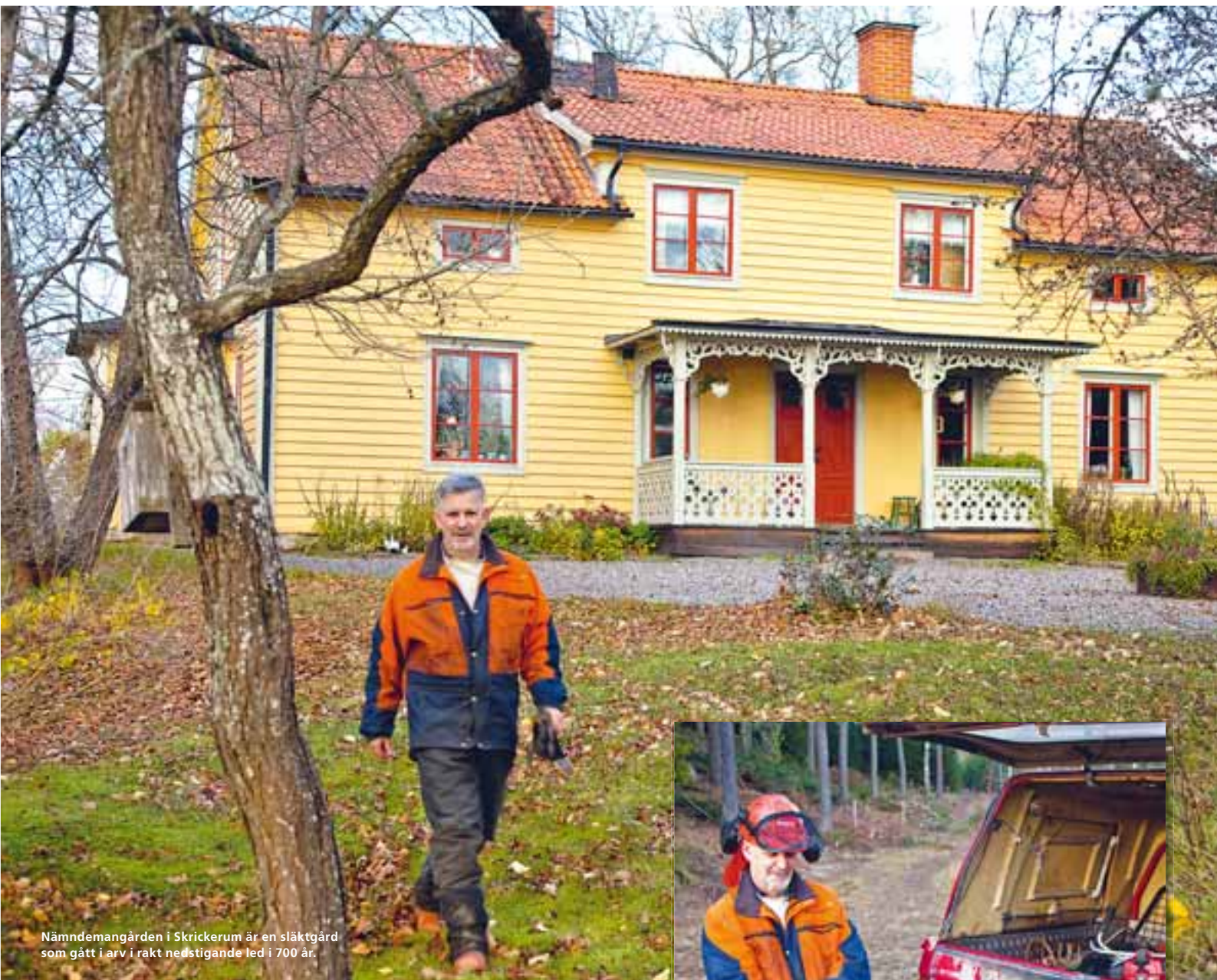
Nämndemangården i Skrickerum är en släktgård som gått i arv i rakt nedstigande led i 700 år.

en klassresa och skapat sig en karriär inom politik, vetenskap, företagande med mera. Arbetsnamnet är "Från Nils Dacke till Astrid Lindgren och Anders Wall".